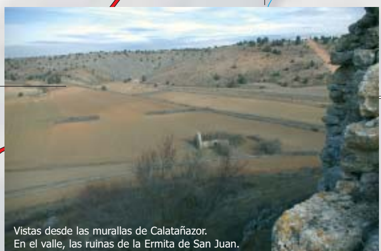
Vistas desde las murallas de Calatañazor. En el valle, las ruinas de la Ermita de San Juan.