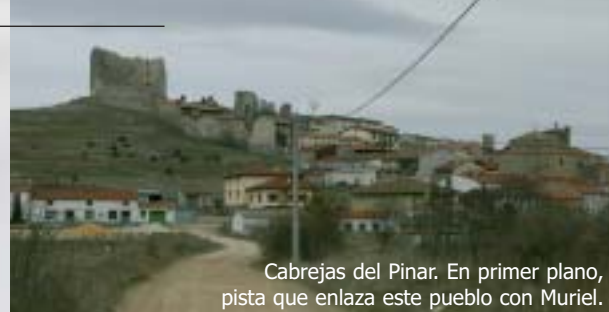
Cabrejas del Pinar. En primer plano, pista que enlaza este pueblo con Muriel.