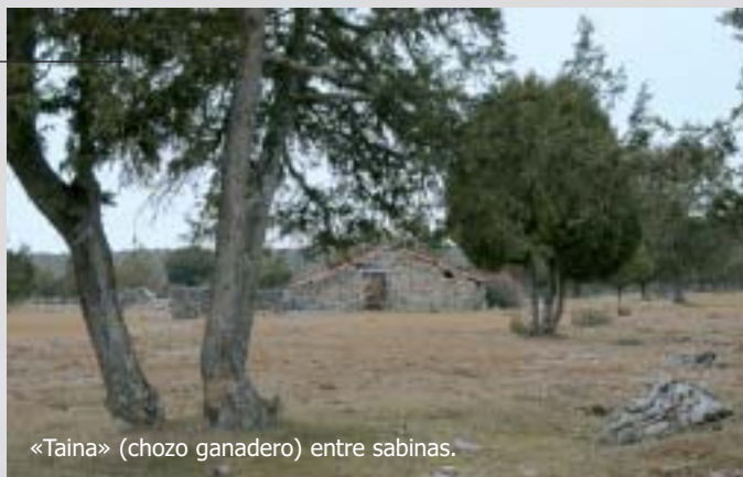
«Taina» (chozo ganadero) entre sabinas.