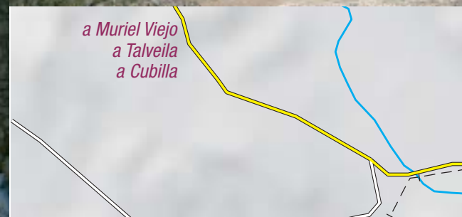
a Muriel Viejo a Talveila a Cubilla