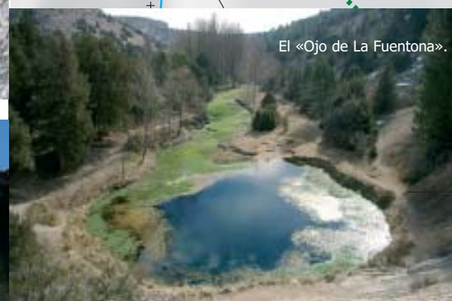
El «Ojo de La Fuentona».