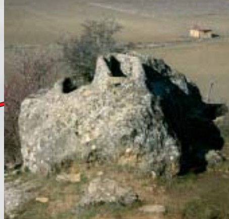
Iglesia de Calatañazor.