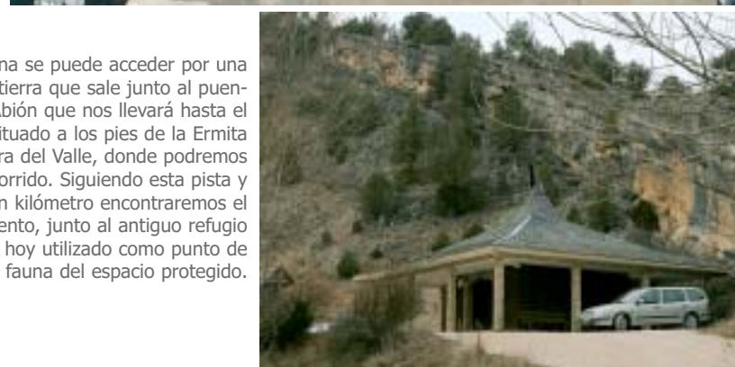
A La Fuentona se puede acceder por una pequeña pista de tierra que sale junto al puente sobre el río Abión que nos llevará hasta el aparcamiento situado a los pies de la Ermita de Nuestra Señora del Valle, donde podremos iniciar nuestro recorrido. Siguiendo esta pista y a menos de un kilómetro encontraremos el segundo aparcamiento, junto al antiguo refugio de pescadores hoy utilizado como punto de observación de fauna del espacio protegido.