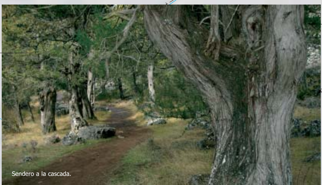
Sendero a la cascada.