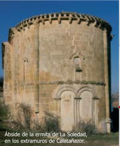
Ábside de la ermita de La Soledad, en los extramuros de Calatañazor.